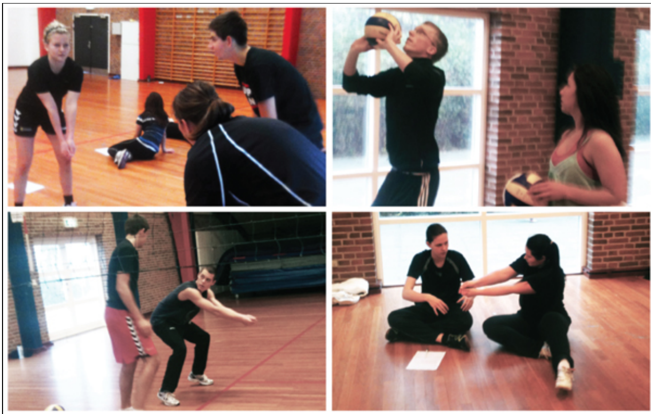
Figur 2 Eksempler på makker-feedback. Både krop og sprog anvendes når der formidles.